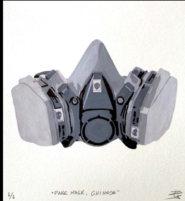
Ricardo Arispe. CovidIntervened Prints (2020).