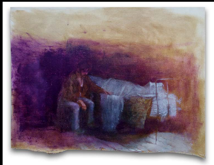
Renzo Rivera. Horror Corporis/Poética del horror (2020).