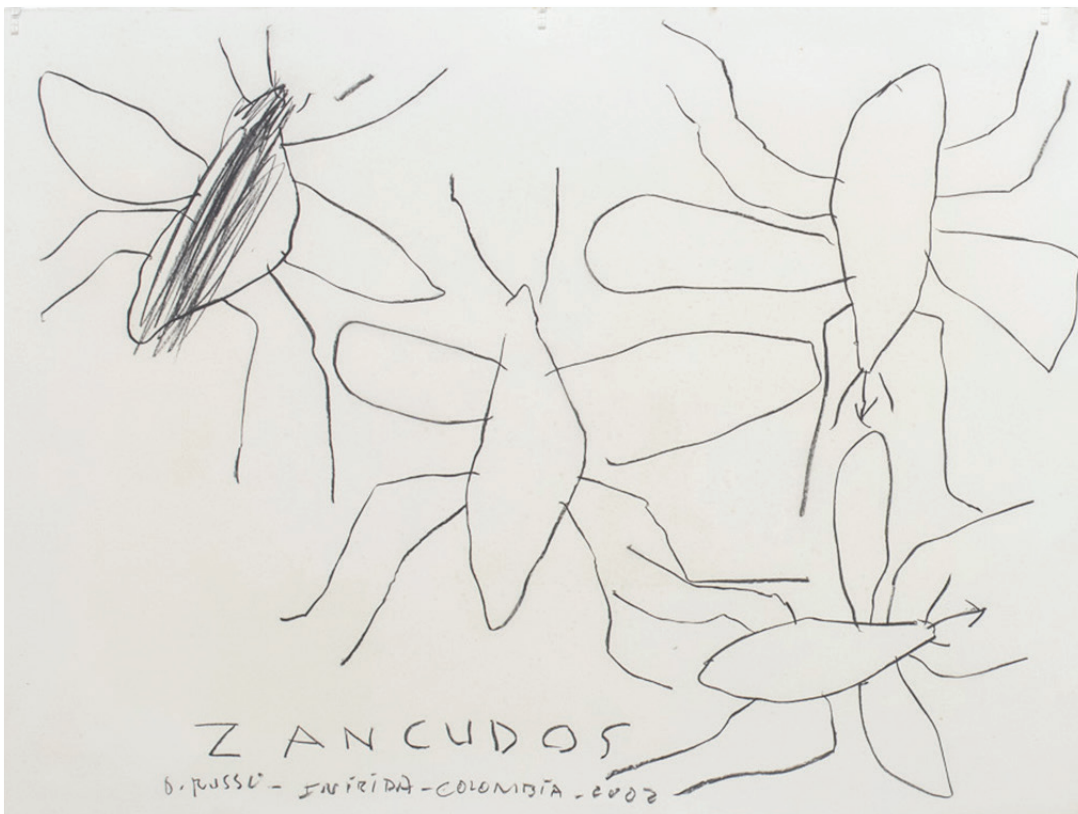
Galería de Papel. (In) Visibilis. Octavio Russo (2021).