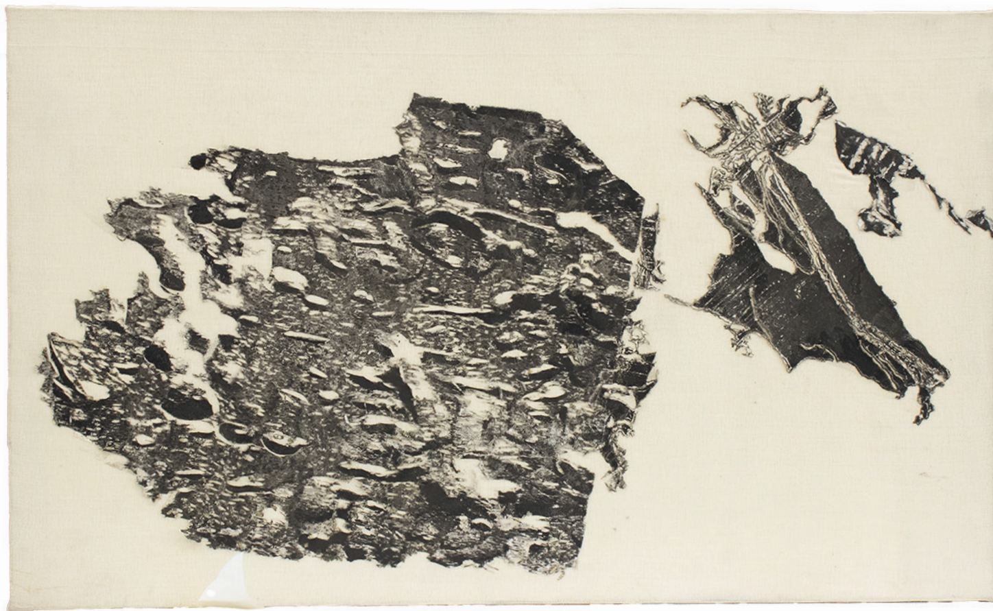
Galería de Papel, (In) Visibilis, Octavio Russo (2024).