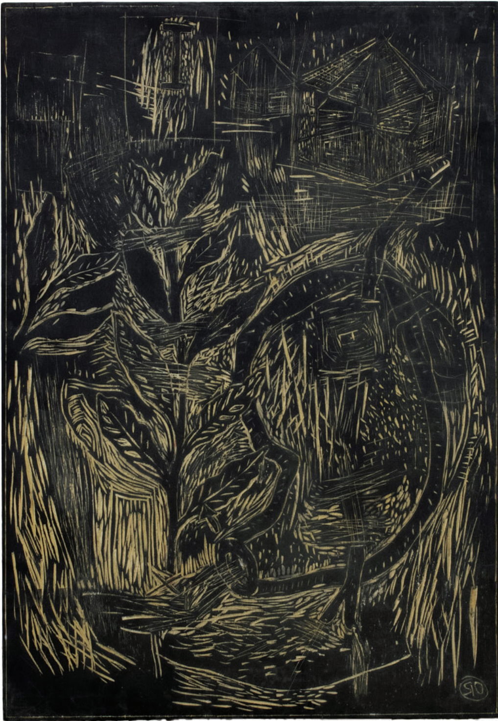
Galería de Papel. (m) Visifilis. Octavio Russo (2024).